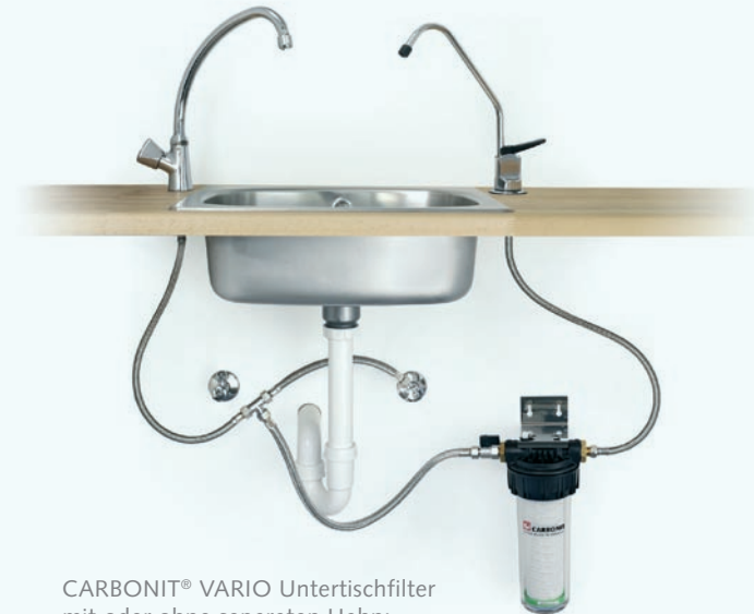
CARBONIT® VARIO Unter Tischfilter mit oder ohne separaten Hahn: Komfort, wie Sie ihn sich wünschen.