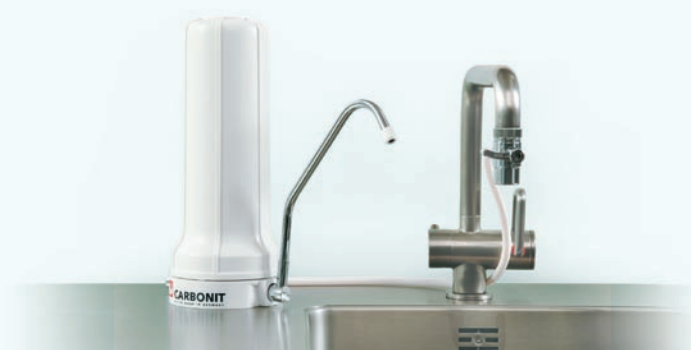
CARBONIT® SANUNO Auf Tischfilter: preiswert, flexibel, schnell installiert.

Einfach. Sicher. Praktisch. Gut. Carbonit-Filter in Ihrer Küche.